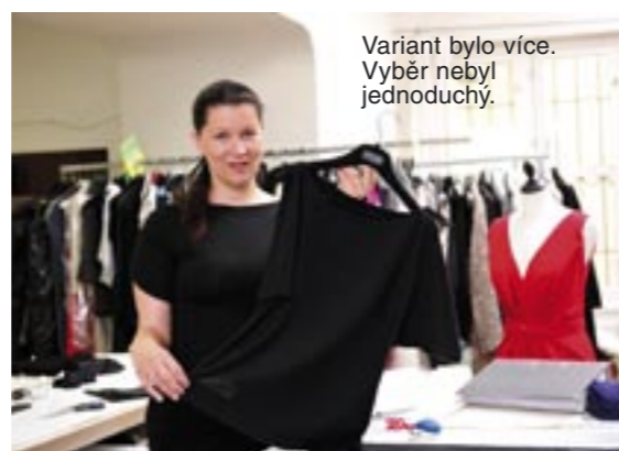
Variant bylo více. Vyběr nebyl jednoduchý.